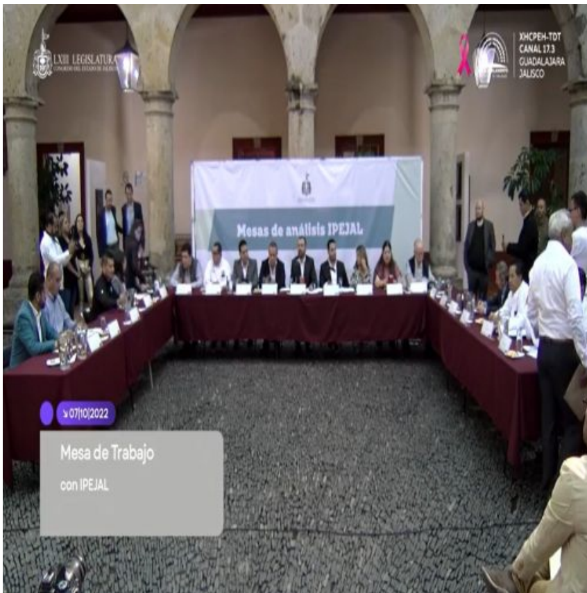
Primera reunión de Mesa de Trabajo con IPEJAL.

7 de octubre se cito por parte del Órgano Interno de Control del Colegio de Bachilleres del Estado de Jalisco a compañeras del plantel 16, para dar referencia respecto a actos considerados posibles irregulares en el ejercicio del servicio público, para ello dando acompañamiento y asesoramiento por el comité ejecutivo SUECOBAEJ y abogado del mismo.